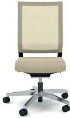
414.1000 + fk100-14