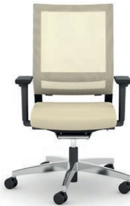
414.1010 + fk100-14 + ls407 + al046-04