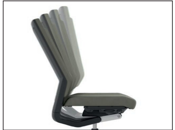
Arretierung der Rückenlehnung / Backrest tilt / Inclinaison du dossier / Blokkering rugleuning