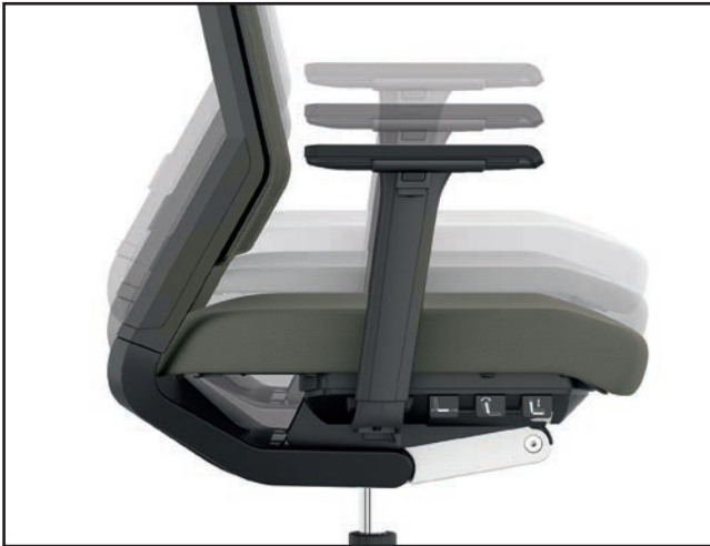
Sitzhöhe / Seat height / Hauteur d'assise / Zithoogteverstelling