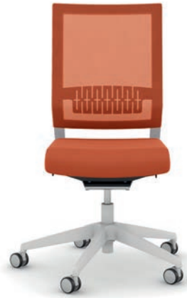
414.1200 + ls405-2