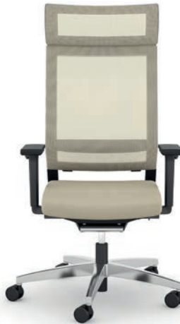
414.1010 + fk100-14 + ls407 + al046-04 + ns410-xx