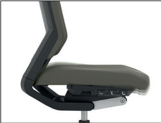
Sitzneigung / Seat tilt / Inclinaison d'assise / Zit-neigverstelling

Integrated function | Fonctions intégrées | Geïntegreerde functies