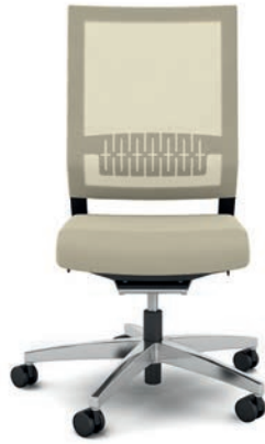
414.1000 + fk100-14 + ls405