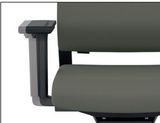
Armlehnenbreite / Armrest width / Largeur des accoudoirs / Breedteverstelling armleuning