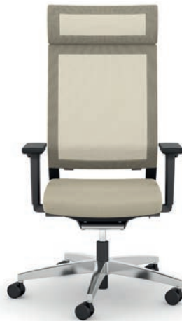
414.1010 + fk100-14 + al046-04 + ns410-xx