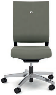
412.1000 + fk100-14