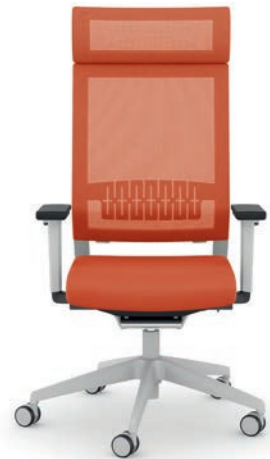
414.1200 + ls405-2 + al003 + ns410-xx