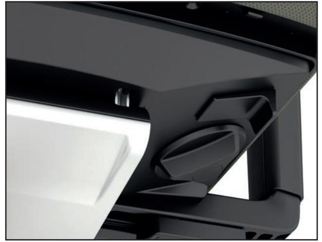
Federkrafteinstellung / Tension adjustment / Tension du dossier / Verstelling weerstand