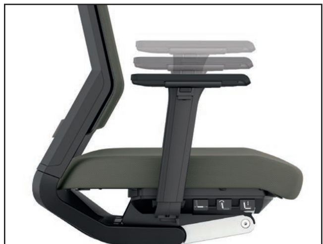
Armlehnhöhe / Armrest height / Hauteur des accoudoirs / Hoogteverstelling armleuning