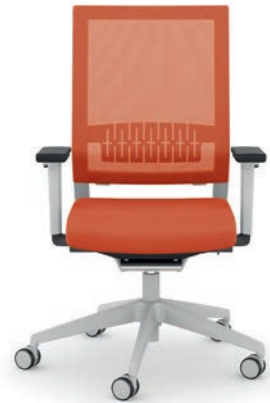
414.1200 + ls405-2 + al003