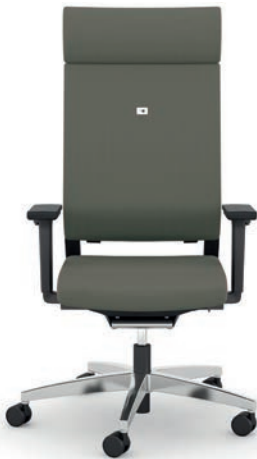
412.1010 + fk100-14 + al046-04 + ns401