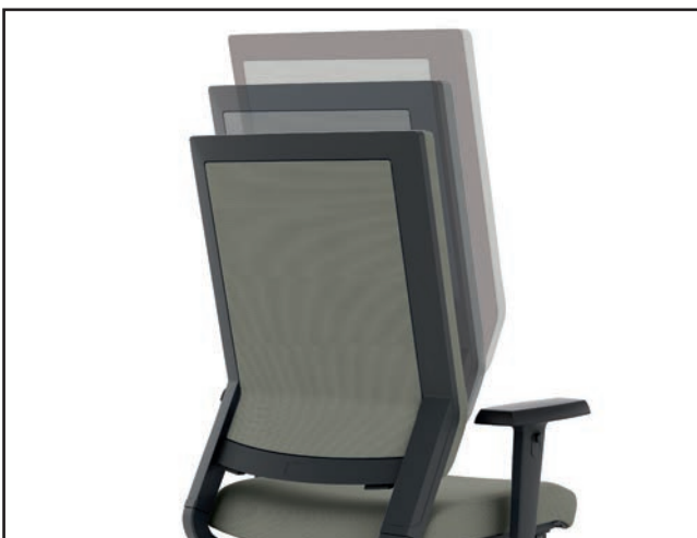
Rückenlehnenhöhe / Backrest height / Hauteur du dossier / Hoogteverstelling rugleuning