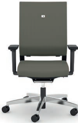
412.1010 + fk100-14 + al046-04