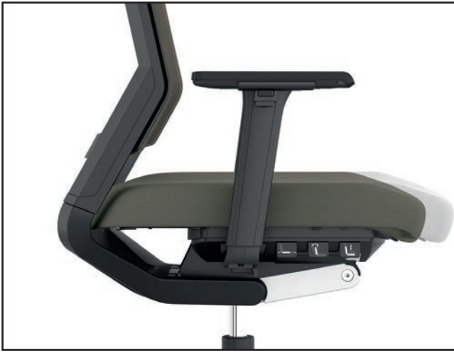
Sitztiefe / Seat depth / Profondeur d'assise / Zitdiepte verstelling