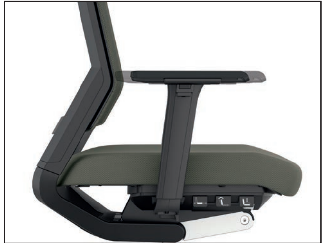
Armlehntiefe / Armrest depth / Profondeur des manchettes d'accoudoirs / Diepteverstelling armleuning